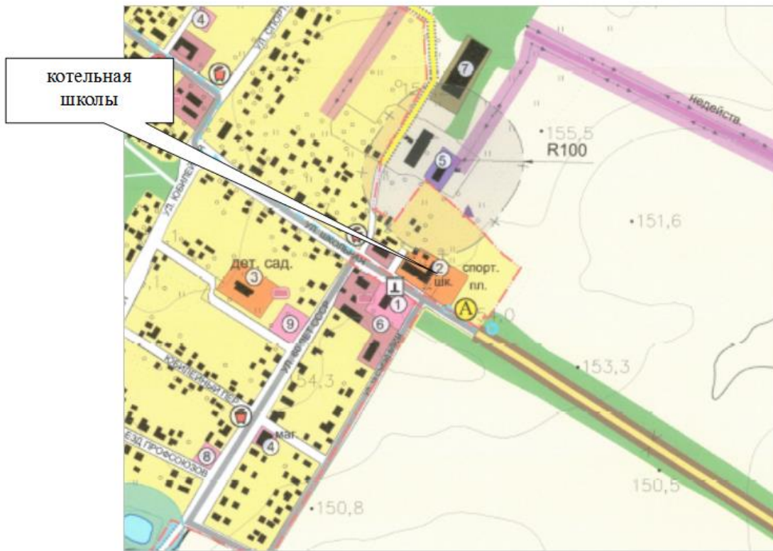
Рисунок 1. Зоны действия котельных