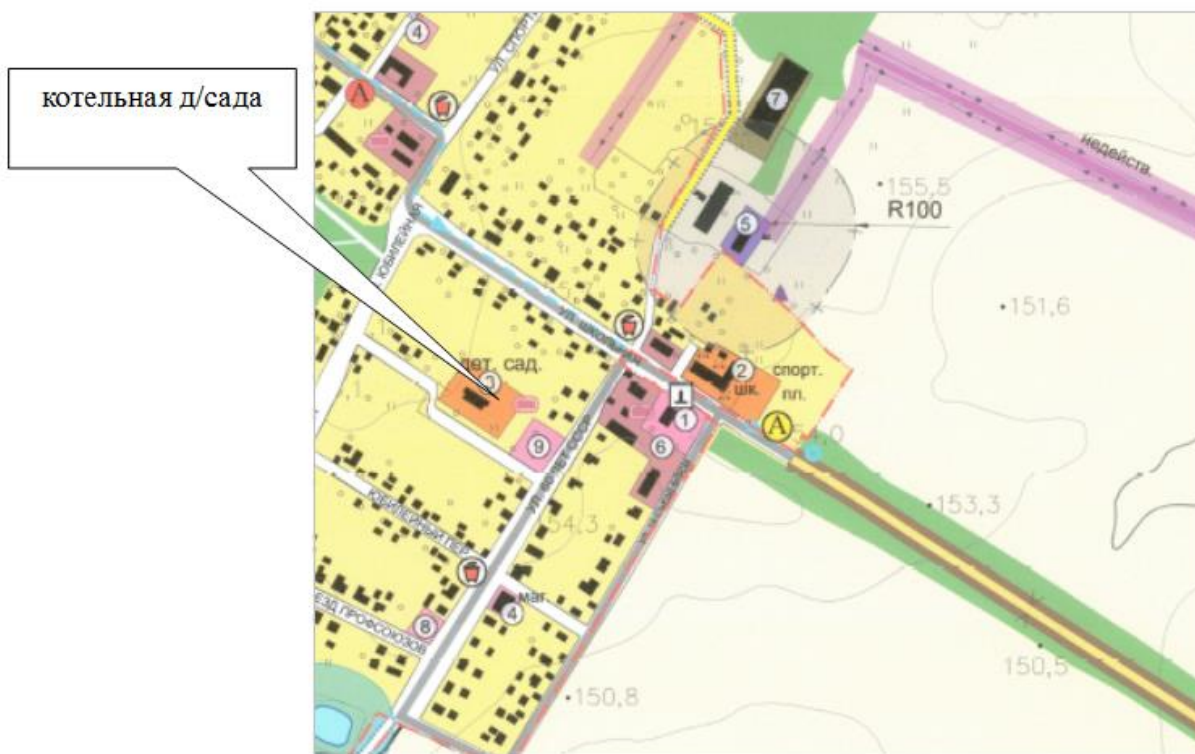
Рисунок 2. Зоны действия котельных

1.6. Часть 5. Тепловые нагрузки потребителей тепловой энергии, групп потребителей тепловой энергии в зонах действия источников тепловой энергии Централизованная система теплоснабжения обеспечивает поставку тепловой энергии потребителям для нужд отопления.