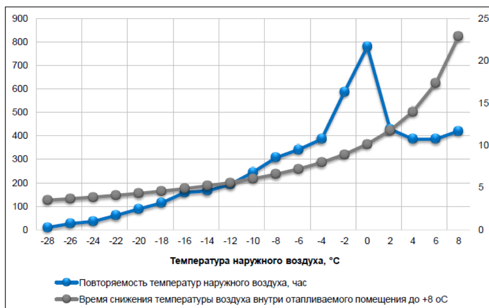
Рисунок 2. Время снижения температуры воздуха внутри отапливаемого помещения до +8 °С

Выводы и предложения по оценке надежности теплоснабжения