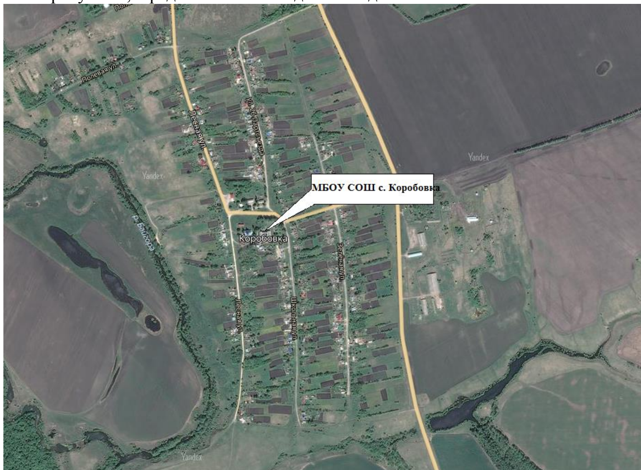
Рисунок 1. Зоны действия котельных

На рисунке 1, представлены зоны действия данных котельных.