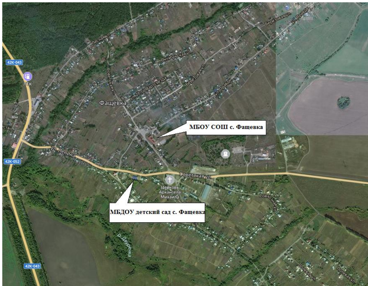
Рисунок 1. Зоны действия котельных

1.6. Часть 5. Тепловые нагрузки потребителей тепловой энергии, групп потребителей тепловой энергии в зонах действия источников тепловой энергии Централизованная система теплоснабжения обеспечивает поставку тепловой энергии потребителям для нужд отопления.