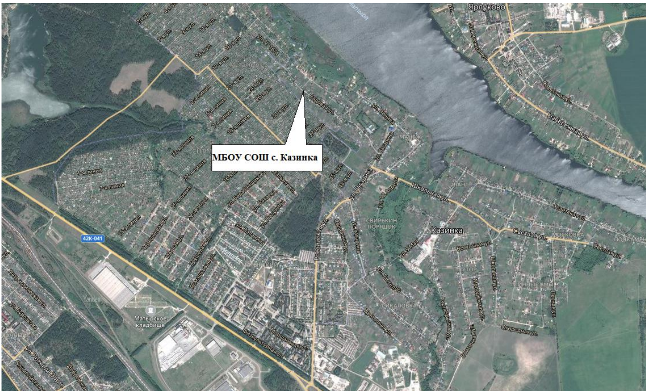
Рисунок 1. Зоны действия котельных