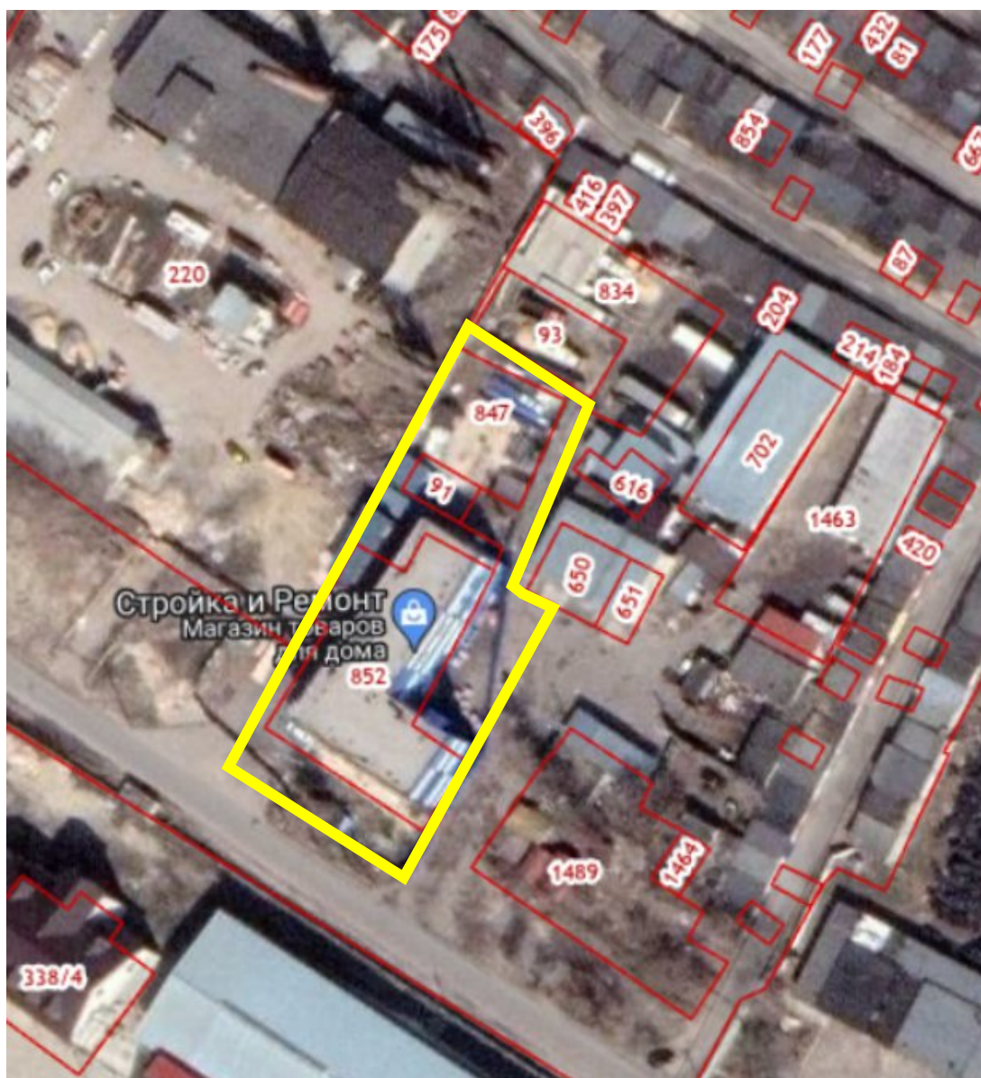
Схема границ территории для подготовки проекта межевания территории в районе улицы Дубовая в с. Казинка сельского поселения Казинский сельсовет Грязинского муниципального района, в части кадастрового квартала 48:02:0940171